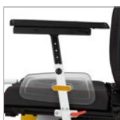
Reposabrazos regulable en altura. Height adjustable armrest.