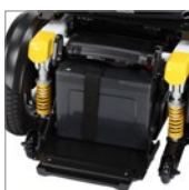
Baterías con capacidad de 75Ah. 75Ah batteries capacity.