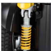
Sistema de suspensión en ruedas traseras. Suspension system in rear wheels.